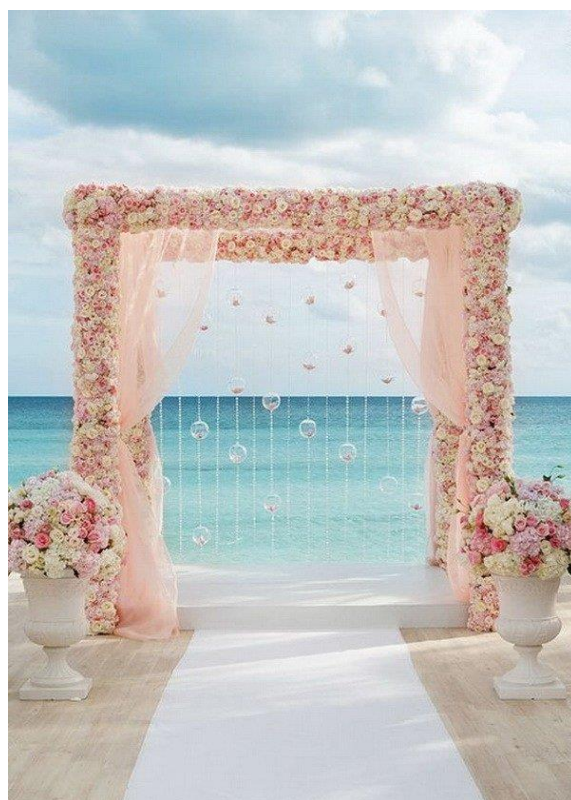
Место для фото